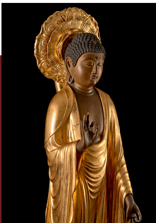
STATUE DE BOUDDHA En bois laqué or - Japon, époque Edo (1603- 1868) Hauteur : 135 cm Estimation : 4 000 - 6 000 €